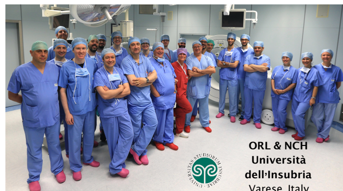
ORL & NCH Università dell'Insubria Varese, Italy